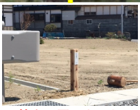
杭を設置しました。