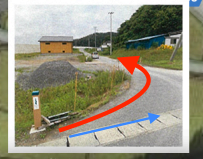
六ヶ浦漁港への入り口