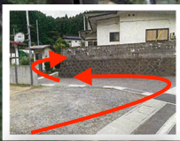
自然歩道への入り口